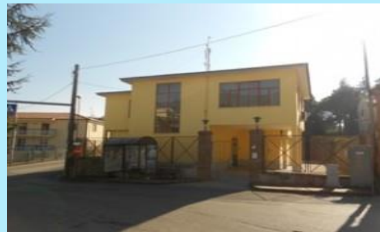
Plesso di Capriglia