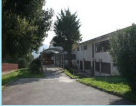
Plesso di Coperchia, via Nicola russo 7 Sede della Scuola Primaria di Coperchia Scuola dell'Infanzia Uffici Amministrativi

SCUOLA SECONDARIA DI I GRADO: Capezzano Via Fravita