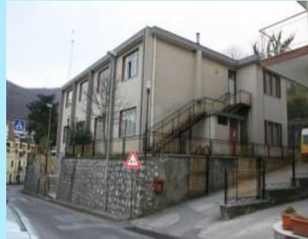
Plesso di Capezzano via Amendola