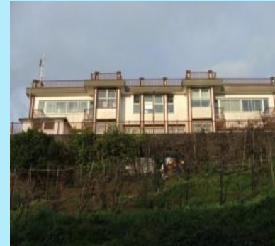
Scuola Secondaria Capezzano via Fravita