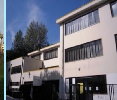
Plesso di Capezzano Quercia