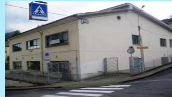
Plesso di Pellezzano Capoluogo