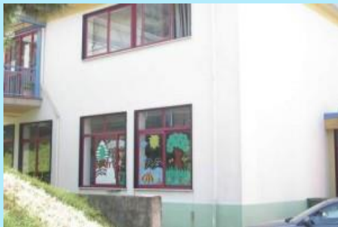
Plesso di Cologna