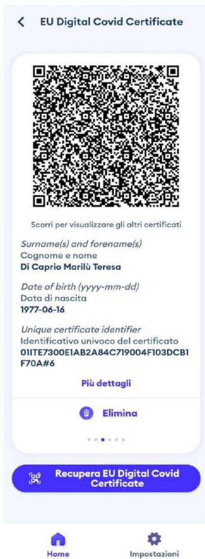
Figura 9 Schermata app Immuni - visualizzazione certificazione verde COVID-19

Nelle figure 9 e 19 viene mostrato come l'utente visualizza la propria certificazione nelle app.