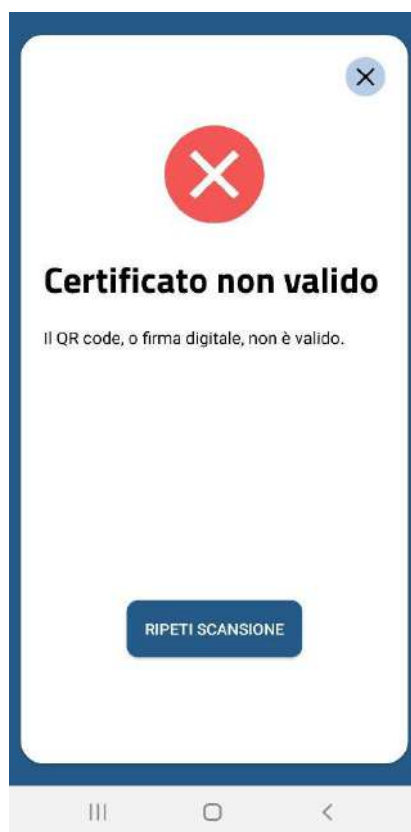
Figura 6 Schermate Verifica C19 - QR code non validato per formato errato o firma non valida