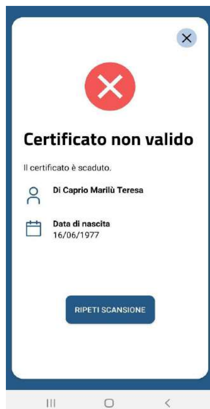
Figura 7 Schermate Verifica C19 - QR code validato correttamente ma scaduto