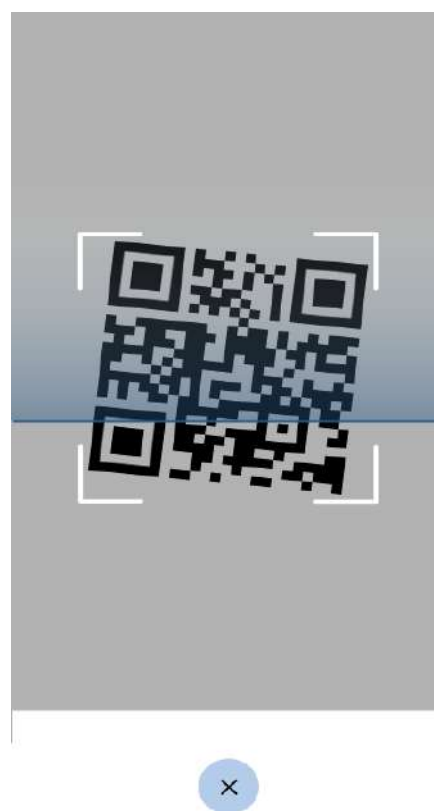
Figura 3 Schermate Verifica C19 - scansione di un QR code