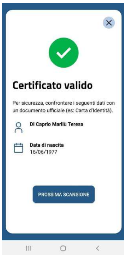
Figura 5 Schermate Verifica C19 - messaggio di conferma per QR code validato correttamente