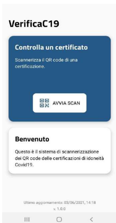
Figura 4 Schermate Verifica C19 - Home

Nelle figure seguenti vengono mostrate le schermate principali di VerificaC19