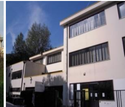
Plesso di Capezzano Quercia