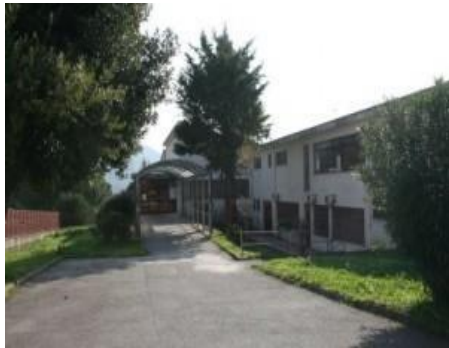
Plesso di Coperchia, via Nicola russo 7 Sede della Scuola Primaria di Coperchia Scuola dell'Infanzia Uffici Amministrativi

SCUOLA SECONDARIA DI I GRADO: Capezzano Via Fravita