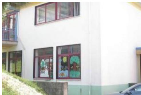
Plesso di Cologna