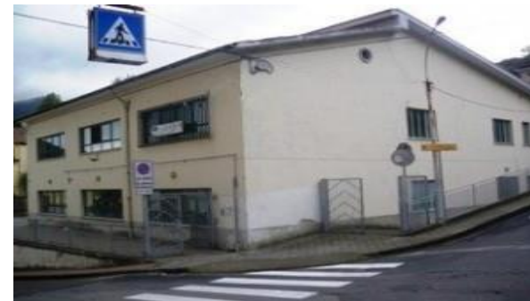
Plesso di Pellezzano Capoluogo