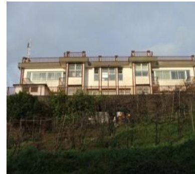
Scuola Secondaria Capezzano via Fravita